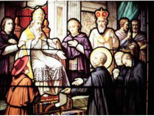
Sehemu ya dirisha lililochorwa picha katika kasri ya Loyola, Hispania. Uidhinishaji wa Jesuti uliofanywa na Paul III katika 1540 Roma.

kushughulikiwa. Luther, Melanchton, Tyndale, Calvin, Wycliffe, Hieronymus, Wesley, Hus, Zwingli, Berquin, Waldensia