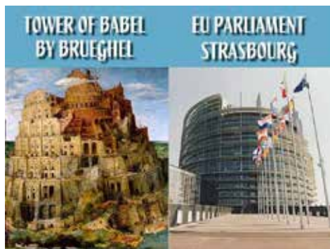
Ulinganifu: Mnara wa Babeli Bunge la Umoja wa Ulaya Babeli Strasburg

“Ama tunapenda au la, ama tuko tayari au la, sisi sote tunahusika katika ushindani wa kilimwengu wa dhati, usio na mipaka na wa namna tatu.... Sisi ni wadau.... ushindani huu unahusu