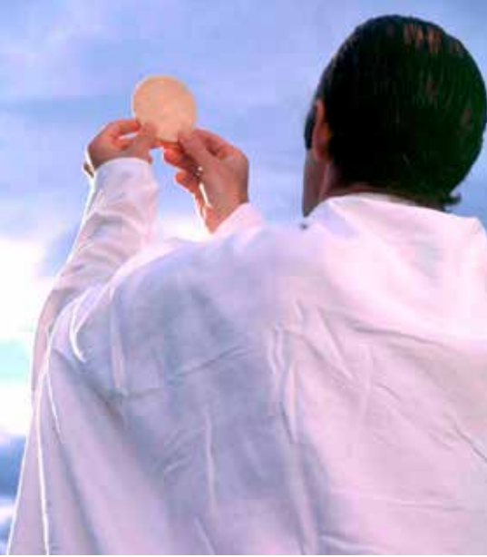
Sherehe ya Katoliki ya Ekaristi

Mnamo Oktoba 31, 2017 viongozi wa Walutheri na Wakatoliki hawakwenda Wittenberg, bali walikutana “kwa siri” huko Rumi. Waliandaa Tamko la Pamoja wakati wa kuhitimisha mwaka wa kumbukumbu ya pamoja ya Matengenezo.