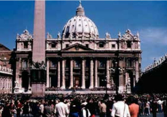
Makao ya papa huko Vatikani

watii. Ipo tofauti kubwa kuwaua maadui na kuwapenda! Watoto wa Mungu watawapenda maadui zao. Yesu, Muumbaji na Mtegemezaji wetu, huwapenda wote (Yohana 1:3; Wakolosai 1:17). Yesu