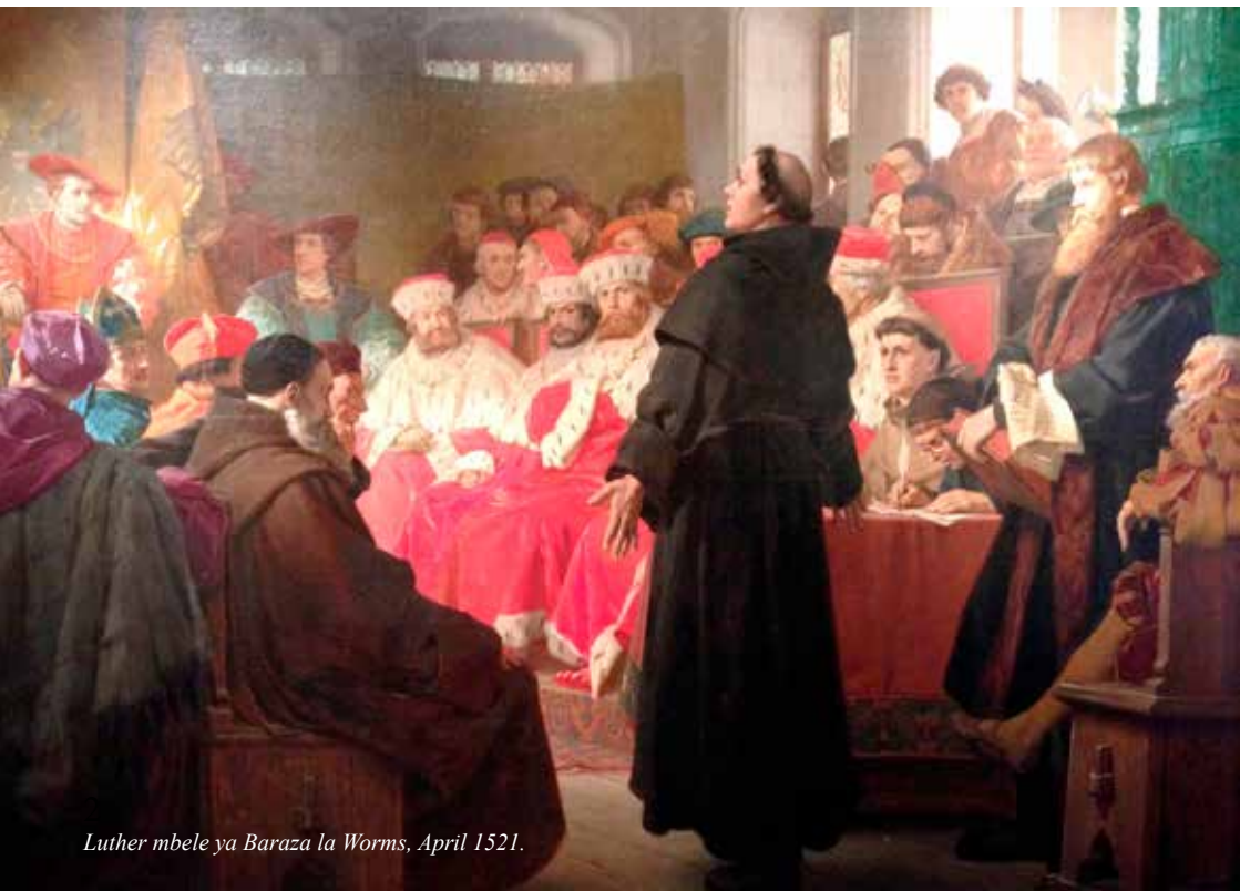
Luther mbele ya Baraza la Worms, April 1521.

Makasisi pekee ndio waliokuwa na Biblia; walitegemewa na watu. Walitumainiwa kuwasilisha neno la Mungu kwa usahihi. Martin Luther, pamoja na hoja zake 95 na mahubiri, alidhihirisha kwamba mapokeo na mafundisho ya makasisi hayakupatana na mafundisho ya Biblia. Hapo yakatokea haraka makundi mawili tofauti ya watu—